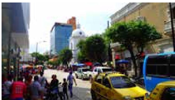
Liv och rörelse på Santa Martas gator

Helt otroliga mängder plast och annat låg och flöt tillsammans med en hel del grova stockar. Efter att ha ropat upp marinan blev vi kungligt mottagna av två mycket glada och pratsamma killar i en gummibåt. De lotsade oss in och hjälpte oss att förtöja. De pratade nästan ingen engelska och bad genast om ursäkt för detta men förklarade att de inne på kontoret kunde engelska. Vi bara skrattade och sa att det inte var någon fara. I vilket fall som helst så hälsade de och alla andra vi mötte på bryggorna hälsade oss välkomna till Colombia och Santa Marta. Alla våra farhågor var från denna stund som bortblåsta.