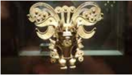
Huvudprydnad av massivt guld

Det är dessutom mycket som är billigt i Colombia. Att gå ut och äta lunch på en av de lokala restaurangerna går på ca 40-50 kr och då får man soppa till förrätt innan huvudrätten och en kall god öl för de pengarna. Det finns också mycket att se på och bland annat guld-museet hade gratis inträde och rekommenderas varmt.