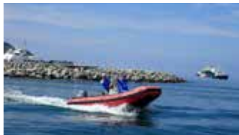
Mottagningskommittén i Santa Marta

Men tillbaka till seglingen. Vi låg ankrade i Spanish Water på Curaçao och gick direkt därifrån till Santa Marta i Colombia. Det är en tur på ca 350 sjömil. När man närmar sig Santa Marta österifrån så kan man om man ha tur med vädret få se snöklädda toppar. Har man mindre tur så råkar man ut för dåligt väder när man rundar den ökända udden Cabo de la Vela. Här varnar guideboken för, och många seglare vittnar om, hårda vindar och mycket jobbig sjö. Det är inte ovanligt att fallvindarna gör så att det blåser 5-10 m/s mer än prognostiserat. Vi hade dock tur och fick en behaglig segling på tre dygn.