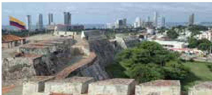
Castillo San Felipe de Barajas, Cartagena

När vi lämnade Santa Marta gick vi endast runt en udde och ankrade vid el Rodadero. Ett litet turistparadis för colombianerna själva. Det var bra ankring och vi fick flera nyfikna och vänliga besök av både trampbåtar och kajaker.